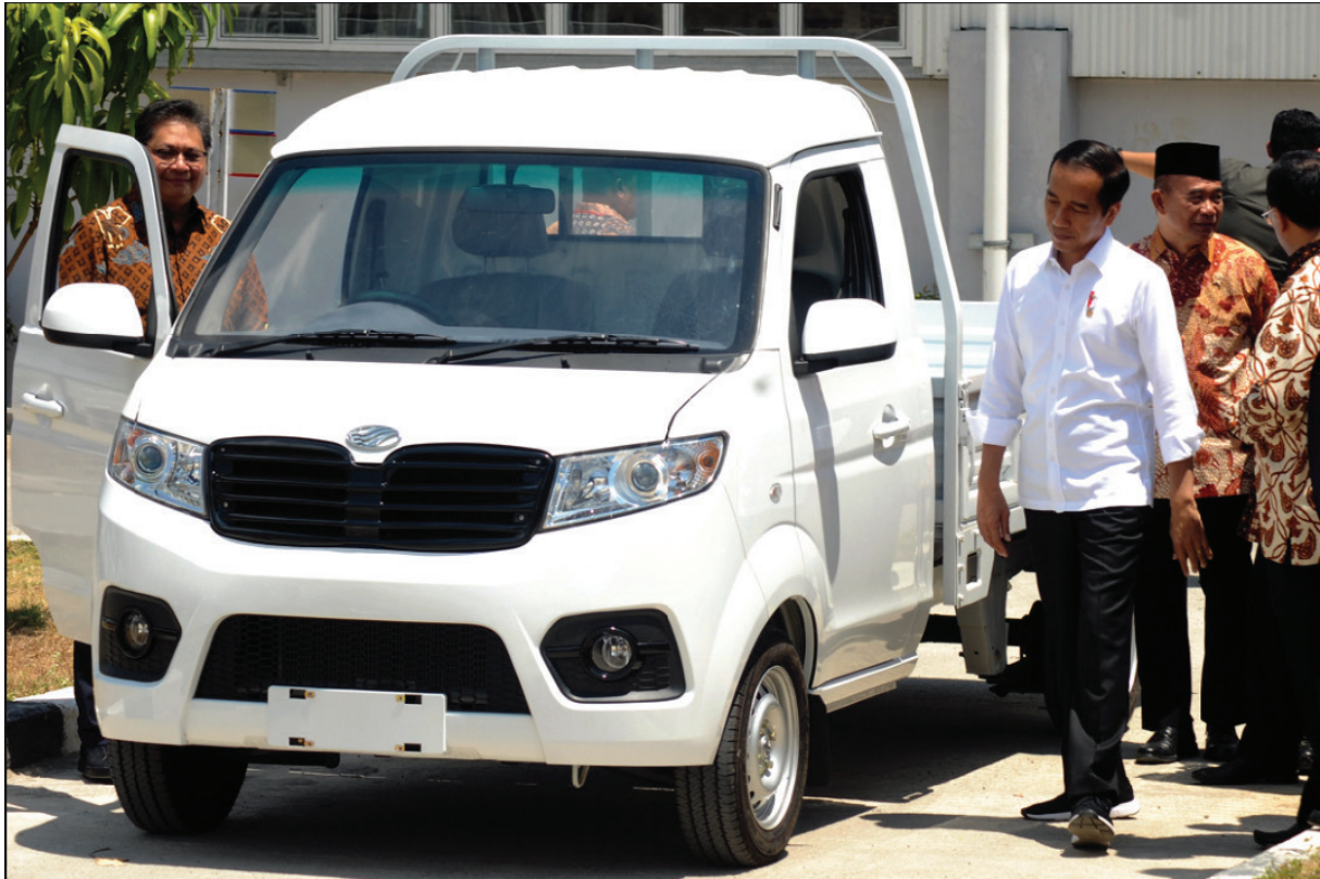
Presiden Joko Widodo (kanan) didampingi Menteri Perindustrian Airlangga Hartarto (kiri) di PT. Solo Manufaktur Kreasi (Es-emka) di Boyolali, Jawa Tengah, Jumat, 6 September 2019.