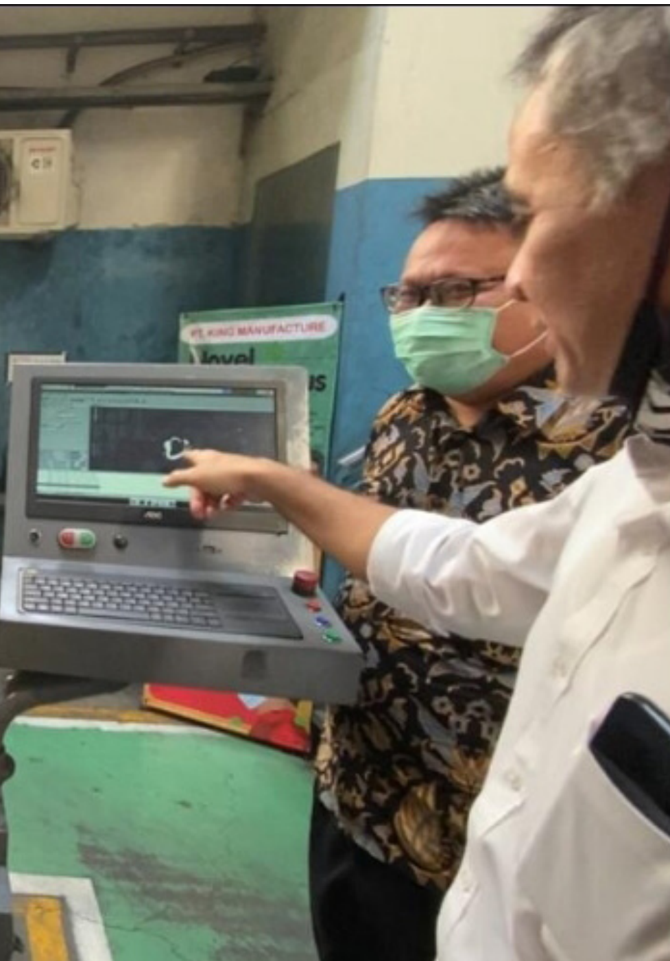
Dirjen Diksi Kemendikbud Wikan Sakarinto (paling kanan) saat meninjau sejumlah SMK di Solo, Jawa Tengah.

P rogram link and match , pendidikan vokasi dengan dunia industri, tidak hanya menghasilkan lulusan yang kompeten dan memiliki daya serap yang tinggi, tapi